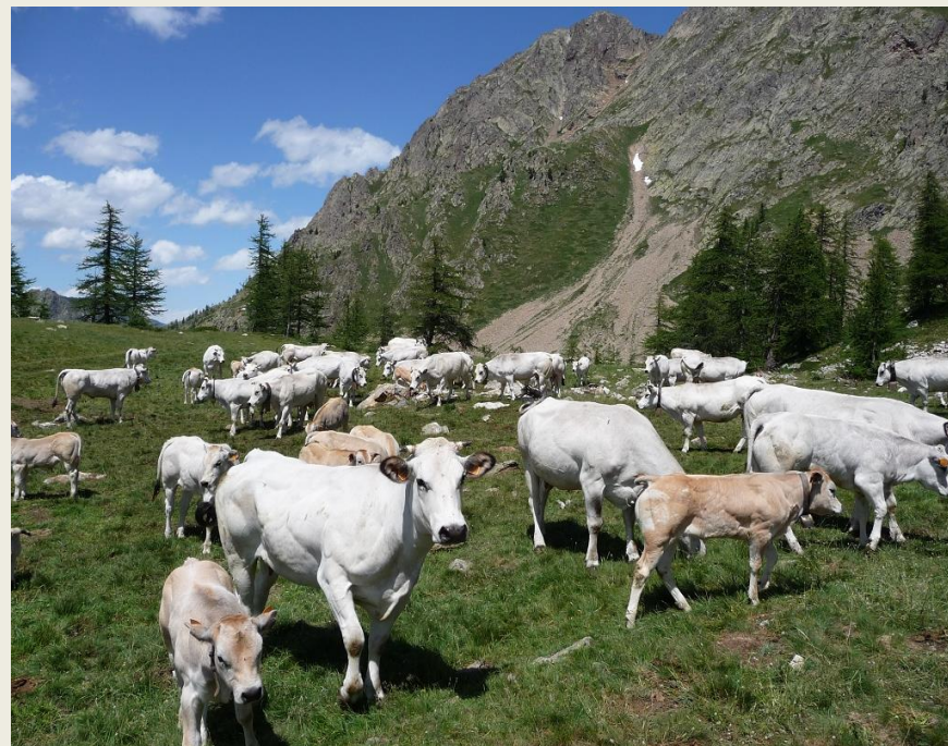
(linea vacca - vitello)